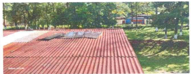
Foto 6: Se observa lo deteriorado totalmente del techo con gotera.

Observación: Si es necesario se pueden agregar hojas adicionales y actualizar el número de hojas.