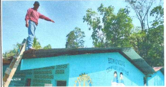
Foto 2: Módulo 1: Se observa el edificio de cuatro aulas y la dirección con techo deteriorado.