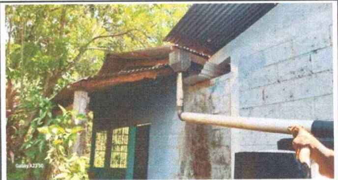
Foto 4: Se observa la humedad a la pared del MÓDULO 1 por la filtración de agua del techo y desprendimiento del canal.