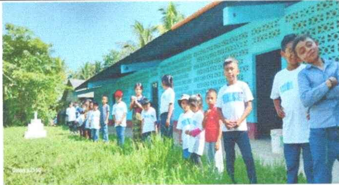
Foto 1: Se observa la falta de un lugar adecuado para los niños del MÓDULO 1, por la gotera y el rayo del sol en las aulas según el cambio de climas.